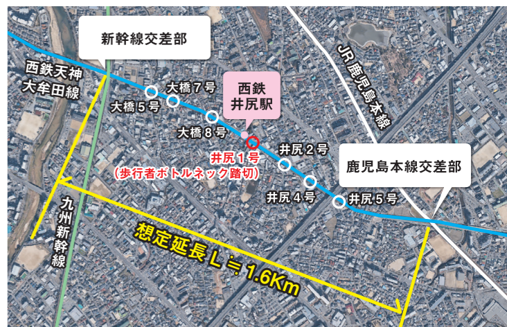
西鉄井尻駅周辺 踏切位置図

他方、雑餉隈地区では令和4年度に高架化が完了していますが、同地区の過去10年の地価変動を見ると、商業地で約23%、住宅地でも約10%も全市平均より上昇しており、高架化事業が固定資産税収増に大きく貢献しています。